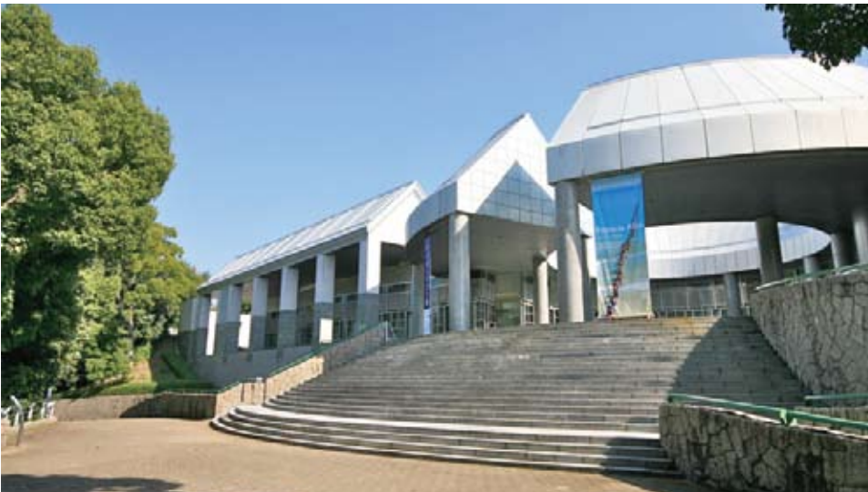
広島市現代美術館。「広島」や「平和」と深い関連のある作品を展示。館内だけでなく、野外にもたくさんの現代アートの彫刻があり、新たな価値観に出会えます。