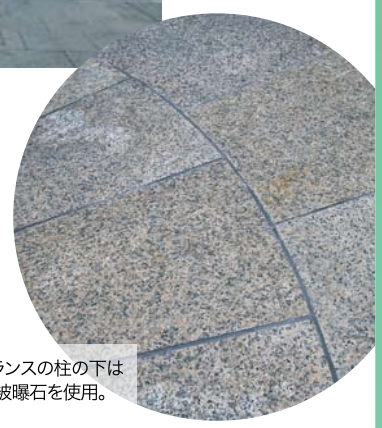
エントランスの柱の下は原爆の被曝石を使用。