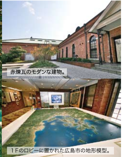
赤煉瓦のモダンな建物。