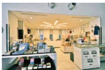
現代美術館内にあるミュージアムショップ。展示会グッズを販売。折り鶴を再生紙にして作ったノート(左)や、ショップで人気の手作りキャンドルもある。(上)