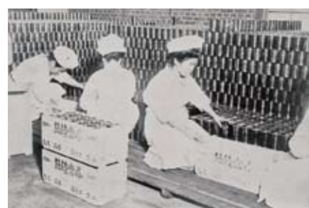
「缶詰箱詰め」

建設以来、大正、昭和と操業し続けた缶詰工場ですが、昭和20年に太平洋戦争が激しくなり、工場の機械を疎開させたため缶詰の生産は中止になります。代わりに、敷地内で畑作りが