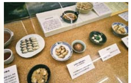
江戸時代にカキ船で提供されていた料理。