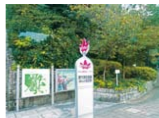
広島市中心部の観光地や美術館を回る循環バス「めいぶる〜ぶ」を利用するのも楽しい。