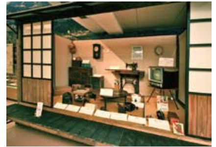
昭和初期の暮らしぶりが分かる生活展示。