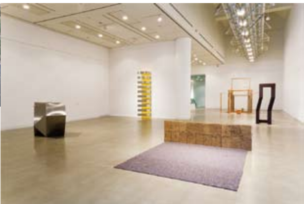
講演会やパフォーマンスなどを行う地下ミュージアム。参加型の作品展示を中心に展開するワークショップや映像作品の上映などバラエティ豊かなプログラムを開催。