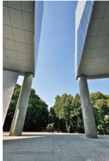
屋根がカットされている方向はちょうど爆心地を示すよう設計されています。