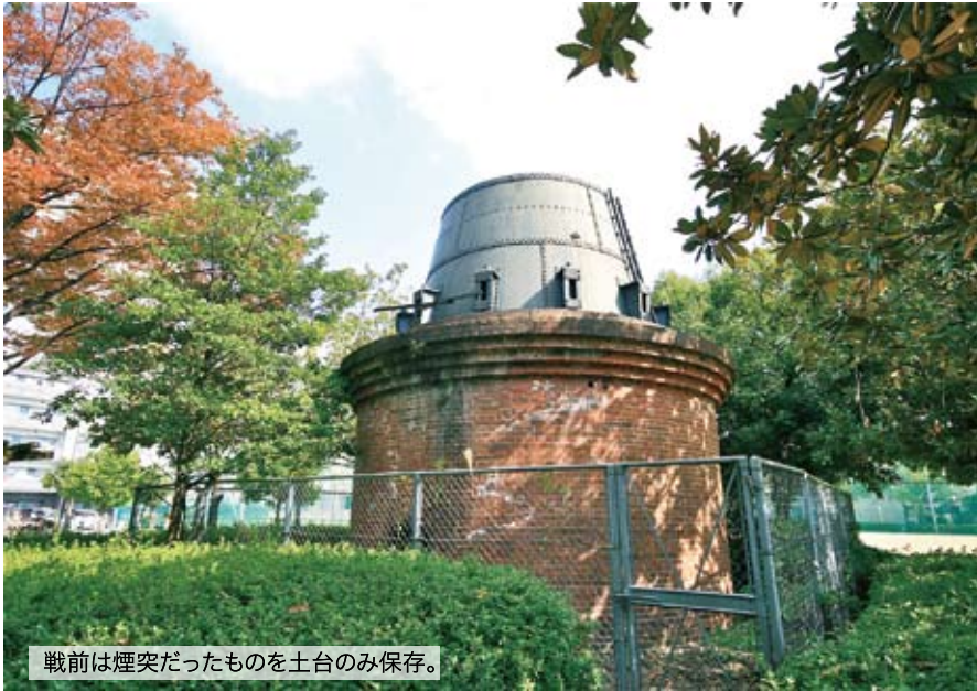
戦前は煙突だったものを土台のみ保存。