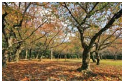
春は桜、秋はモミジが楽しめます。特に約1,300本の桜が咲く季節は多くの方が訪れます。