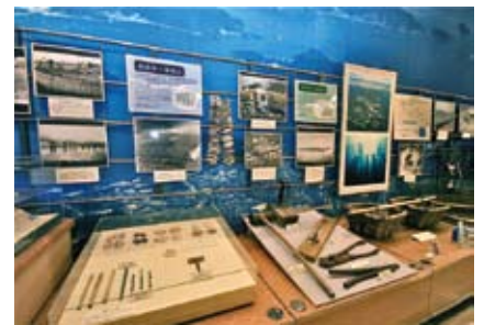
カキ養殖の歴史を写真や模型で展示。