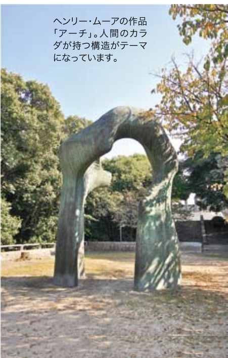
ヘンリー・ムーアの作品「アーチ」。人間のカラダが持つ構造がテーマになっています。