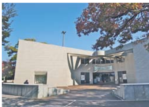
広島市まんが図書館。笛吹き少年のブロンズ像が目印。まんが図書館の入口左手のショーウィンドウではテーマに沿った漫画を展示しています。