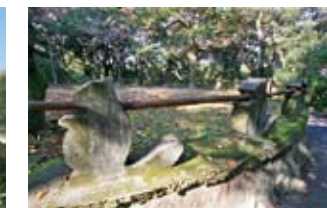
公園の周りをグルリと囲むキュートなタヌキのオブジェ。