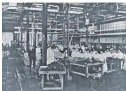
「実工場内大正15年4月」広島市郷土資料館 蔵