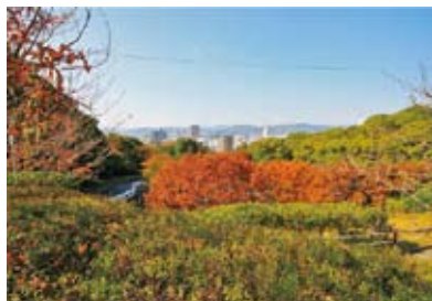
都心の喧噪を忘れて、ゆったりとくつろげます。小高い丘の上にあるので、広島市内や瀬戸内海も一望できます。