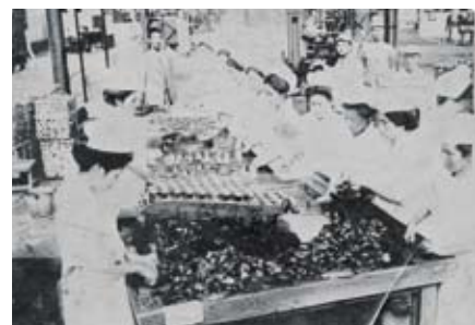
「工場内肉詰め作業」

広島市郷土資料館は、もともと明治44年に宇品陸軍糧秣支廠(陸軍用の食料を集めたり、作ったりする施設)の缶詰工場として建設されました。洋風の赤レンガ造りの美しい外観は、当時としては洋風建築を代表する建物でした。