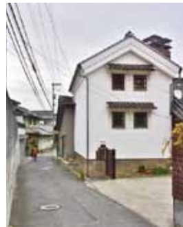
各所に見られる土蔵。中には、かなり年季がはいったものも。