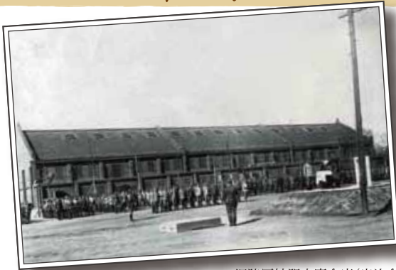
旧陸軍被服支廠倉庫(出汐倉庫)

500~600人いた職工のうち、女性が過半数。広電宇品線・皆実線の電車通りから被服支廠へ通じる道は、通勤者で賑わった。現在残されている4棟は県が一括管理し、再利用方法を模索している。