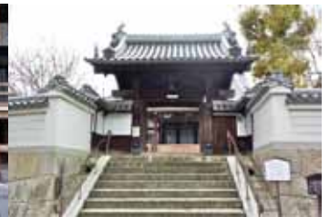
1501年の開基といわれる「西福寺」。現在の本堂は1817年に再建。浄土真宗を開いた玄清以後、その子孫が住職を継承。本堂裏には、明治天皇が訪れたというサツキで名高い庭園がある。

営まれていたことを感じさせる。狭い路地を行くと各所で遭遇する多数の土蔵はその証の一つである。古い寺社が多いのも、昔から船舶の出入りが盛んで、早くから村落が開けていたことを物語っている。車ではちょっと通りたくない道も、探検のように歩き回るのは楽しい。「仁保郷土史会」が立てている案内板などを頼りに、小さな発見散歩を楽しんでみてはいかがだろうか。