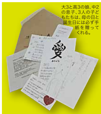
大3と高3の娘、中2の息子、3人の子どもの手紙は、母の日と誕生日には必ず手紙を贈ってくれる。

手紙のいくつかは手帳に挟んでいつも携帯。疲れた時に見ると「この子たちのために頑張ろう」と元気をもらえる、とっておきの宝物になっているようです。