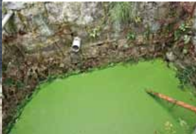
水面がびっしりと緑の水草に覆われている「真緑の井戸」。その名の通り、驚くほどの緑色。