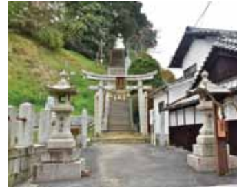
1722年に住民の幸福と家内安全、家門の繁栄を祈念し、勧請された「竈(かまど)神社」。