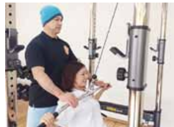
トレーニングは基本60分。回数券利用で1回5,000円〜。3,000円で初回体験可。