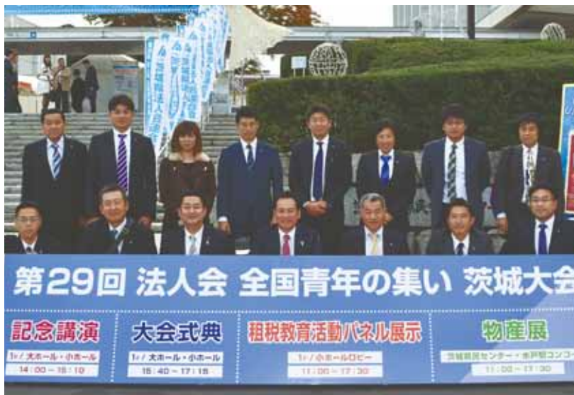
「大会会場前にて広島南法人会より参加者全員で記念撮影」

活動をご理解しご尽力いただいた本会および関係者皆様に重ね重ねお礼を申し上げますと共に、我々はこれからも日々研鑽し邁進してまいりますので、皆様には今後ともお力添えいただきますようお願いいたします。