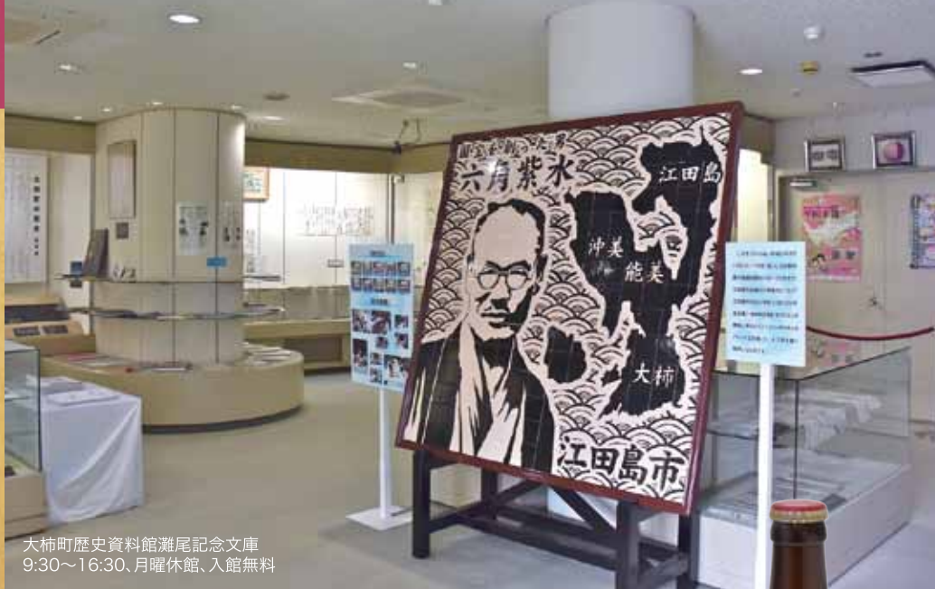
大柿町歴史資料館灘尾記念文庫 9:30~16:30、月曜休館、入館無料