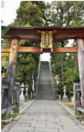
古い歴史を持つ邇保姫神社。ここの獅子舞は昨年、広島市指定重要無形文化財に指定された。