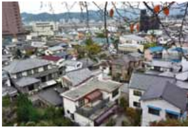
黄金山から見下ろす仁保の町並み。

毛利時代からあると言われる「案内地蔵」。地蔵尊が観音寺の参道に向けて指差す姿に彫られているので、「案内地蔵」と呼ばれるようになったとか。