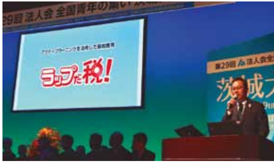
最優秀賞発表の瞬間。

大会式典にて来賓の方々や全国から集まった青年部会員の皆様の前で発表し、おおいに会場が盛り上がりました。