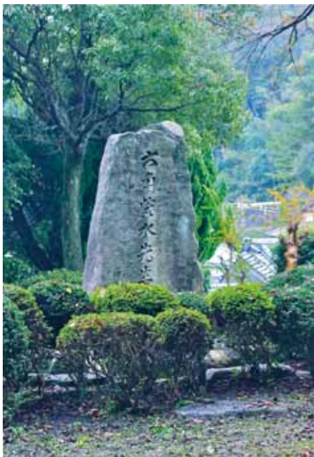
六角紫水の生家跡に建てられた石碑。静かな故郷の自然の中にひっそりと包まれる。