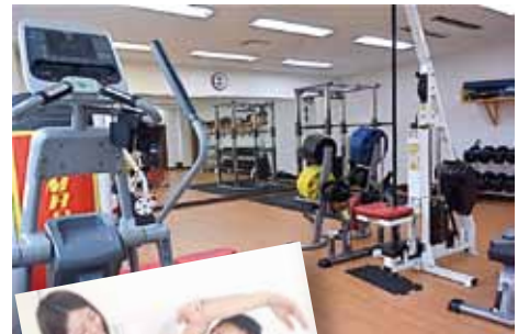
体をほぐし姿勢を整えるストレッチコースや、キッズトレーニングコースもある。

段原にあるパーソナルトレーニング&ストレッチスタジオTrim(トリム)広島。パーソナルジムと言っても、短期間で急激な負荷とストレスをかけて結果を出すのではなく、その人に合ったペースで筋力を維持し、健康管理することを目的としている。