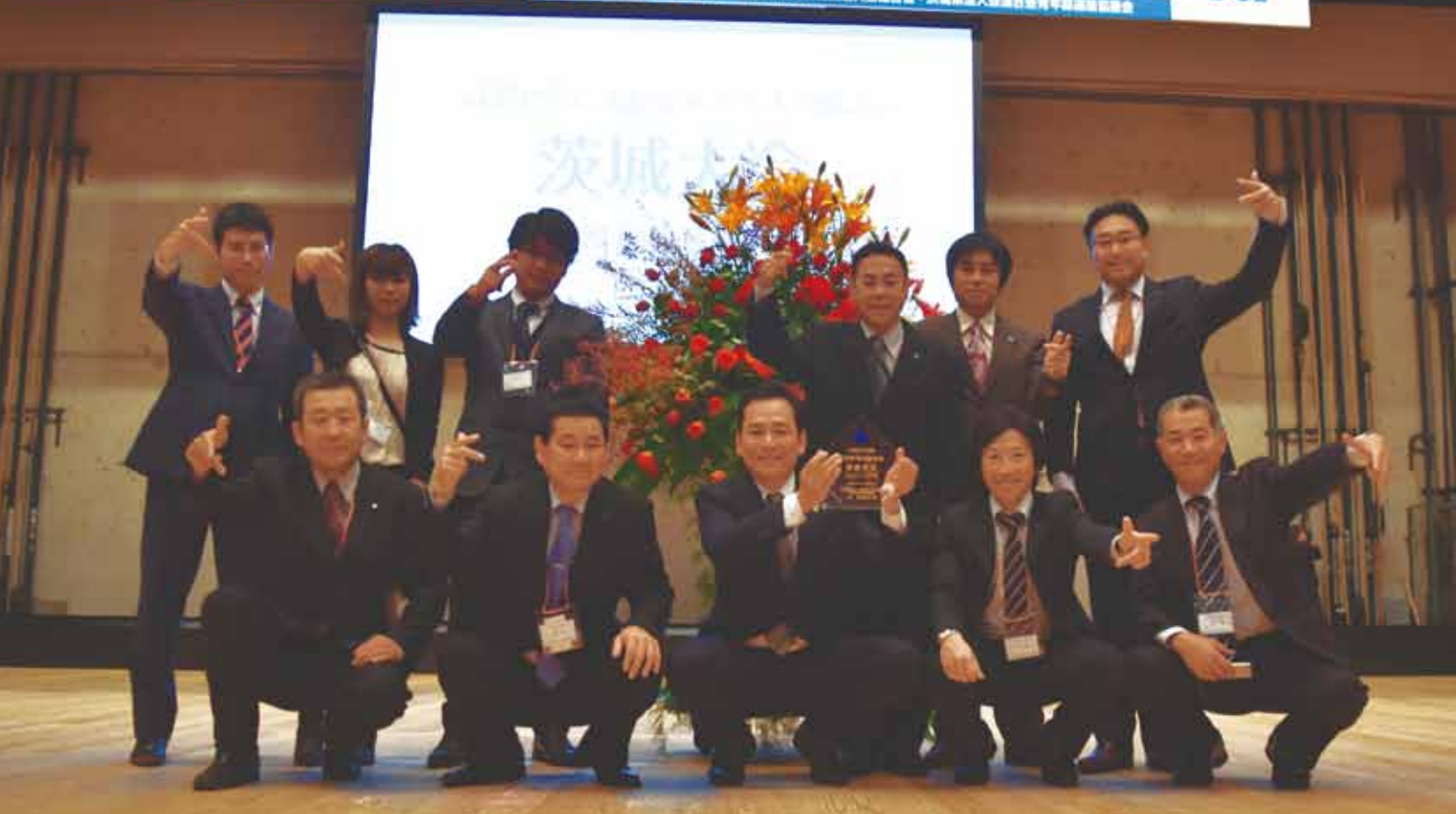
『全国青年の集い』茨城大会にて