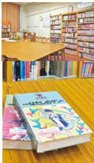
外国美翻訳本や広島ゆかりの作品のコーナー。「はだしのゲン」は多くの国で読まれていることがわかる。