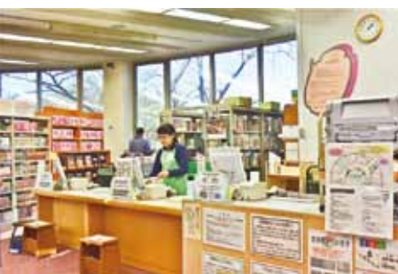
貸出カウンター。貸出機(右)を利用して、自分で手続きすることもできる。