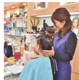
10分エステは、買い物ついでにできると好評。メイクのアドバイスも。

江田島で化粧品の提供を続けて30年の「かしま」。島のマダム達の美を支え続け、馴染み客も多く、最高齢のお得意様は97歳。希望に応じて、自宅はもちろん、老人ホームへの配達も受けているという。