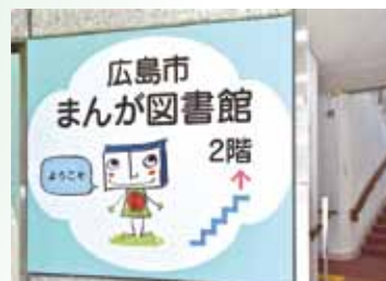
公募で選ばれたマスコット・キャラクターのマッピーがご案内。

おもしろその年まんが大賞 毎年年末年始に作品を募集。全国や海外からも応募がある。今年1月15日(日)が締め切り。 https://www.library.city.hiroshima.jp/manga/