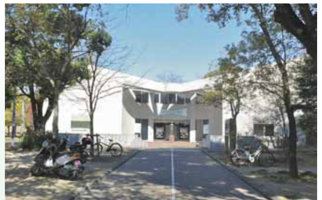
10:00~17:00で月曜休館。広島段原ショッピングセンター駐車場は、駐車券提示で2時間無料サービスあり。