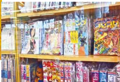
貴重資料コーナーには、ジャンプやコロコロコミックスの創刊号なども並んでいた。