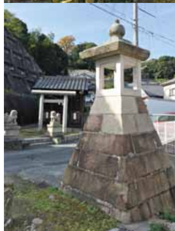
もう一つの見どころは「広島椿」(写真中)。浅野長晟公の妻で徳川家康の三女、振姫が江戸で育てていた椿をこの地に植えたと言われる。赤白絞りの赤無地を咲き分け見事。写真は寺の下の住吉神社と常夜灯。

真正面に金輪島が浮かぶ瀬戸内海を見下ろす元宇品の小高い地に、小さな寺がある。寺から続く石段は住吉神社の小さな社と古い常夜灯に続き、昔はこの直下まで海だったことを物語っている。中興は1600年頃だが、開基はもっと以前と見られる「観音寺」である。