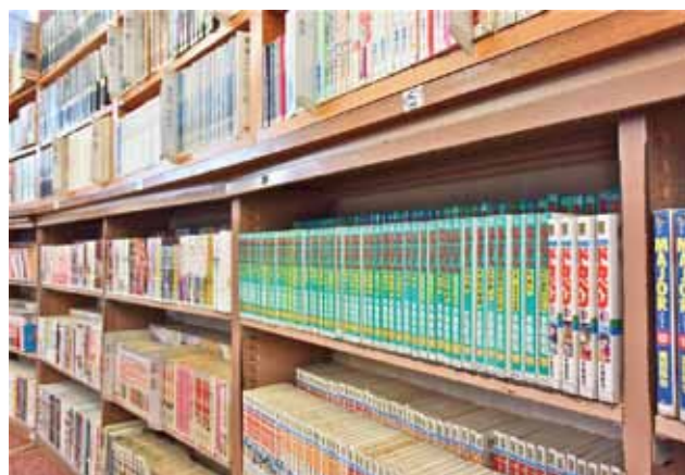
作者の50音順で作品が並ぶ。人気作や最新刊は貸出不可のことも。