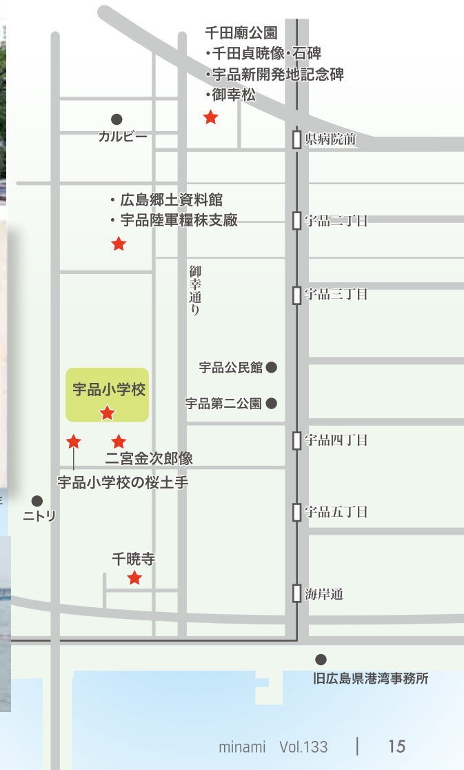
明治44年に宇品陸軍糧食支廠(りょうまつししょう)缶詰工場として建てられた建物は、現在広島市郷土資料館として活用。