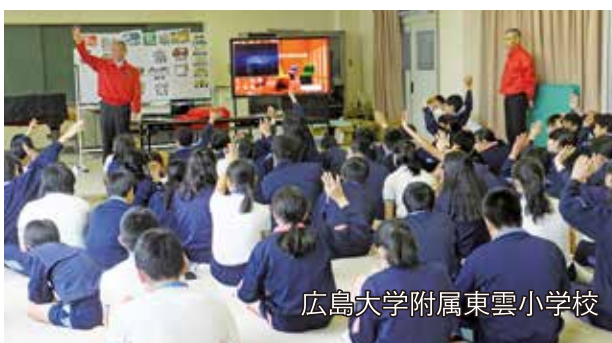
広島大学附属東雲小学校