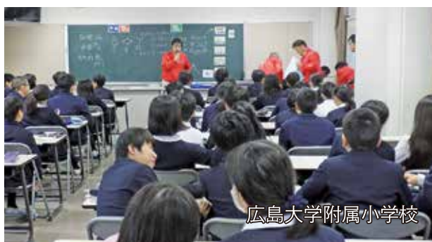
広島大学附属小学校