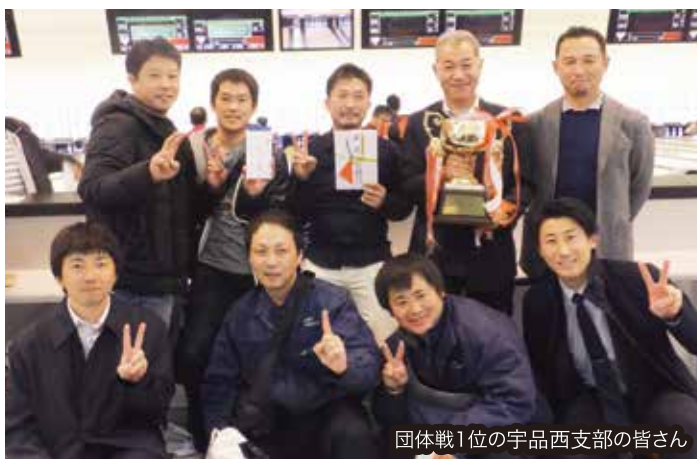
団体戦1位の宇品西支部の皆さん