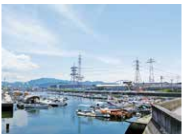
大河港など、川岸に小さな船溜まりが点在する仁保エリアは、かつてこの地区が漁村であった名残をとどめる。