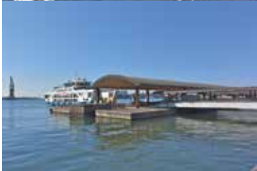
定期船の切符の販売や待合などの機能を果たす広島港宇品旅客ターミナル。3階の展望台からは港を一望できる。