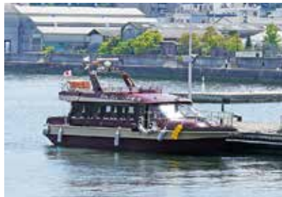
竹原港と大久野島を結ぶ「うさぎの想い出航路」の船。コロナ禍で運休中のため、広島港で思わぬ出会いに。