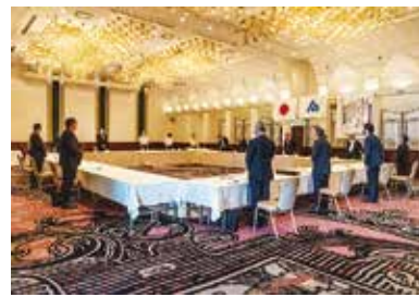
物故者への黙祷のために起立。ソーシャルディスタンスが保たれた席の配置に。

令和2年度の事業計画については、例年通り行うことを前提に作った予算であるが、旅費交通費や会議費などが相当変わってくる可能性があることが伝えられまし