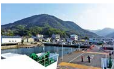
広島港からフェリーが運航する江田島の三高港。夕日も美しい航路。