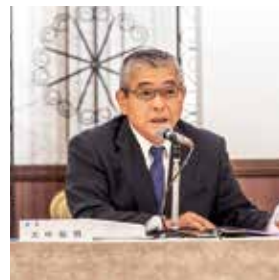
先の読めない状況が続ぎ、大変な思いをされている会員企業も多いが、南法人会としてできることを知恵を出し合って支え合っていきたい、と大中会長。

た。大中会長からも、全国大会、女性フォーラム、全国青年の集いなど、中止の連絡が入ったとの報告がありました。