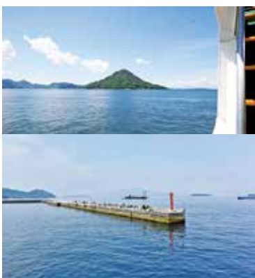
「安芸小富士」で親しまれる似島は、魚釣りや山登りに訪れる人が多い。