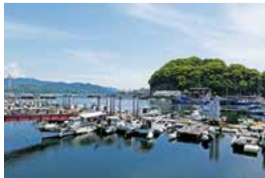
広島港の船溜り一帯では、様々な船が繋留されているのを眺めることができる。