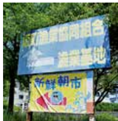
坂町の漁港付近には、カキの養殖直売などの水産会社が軒を連ねる。