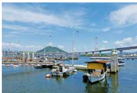
古くより漁業が盛んな坂町の漁港。現在は、広島大橋と海田大橋を望む絶景の海に。