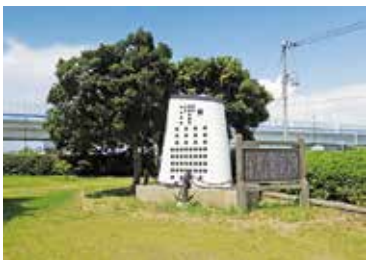
宇品中央公園にある唱歌「港」の歌碑。本土と元宇品を結んでいる暁橋(通称・めかね橋)から見た風景を歌ったとされる。