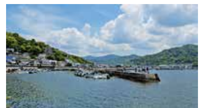
坂町の横浜港は、様々な魚が狙える釣り場としても人気。イカやアナゴ、タチウオなども狙えるとか。