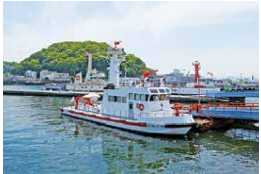
広島港と似島や金輪島などの消防防災体制の強化を目的に消防艇「ひろしま」も配備。3月の「みなとフェスタ(2020年は中止)」では展示放水も披露。