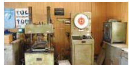
JIS規格に基づき工場内で圧縮強度試験を行っている。

消防署や学校、護岸ブロックや砂防堰堤など、私たちの身の回りでたくさん使われているコンクリート。株式会社三奈戸は製造した生コンを8台のミキサー車で毎日現場まで届けている。