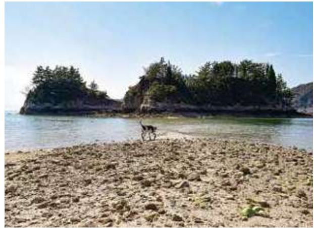
アクアマリンロードの向かいにある茶臼島。潮が引くと渡れる道が現れる。