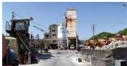
三奈戸は今年創業62周年を迎える老舗生コン会社だ。