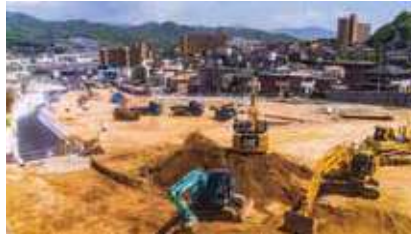
今工事中なのは、二葉山トンネルの中山、温品あたりの道路の造成。多くの重機が入り立派な道路になった。