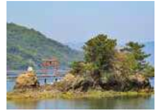
ネイビーロードの先に佇む船霊社