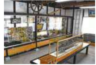
利根公園にある軍艦利根資料館