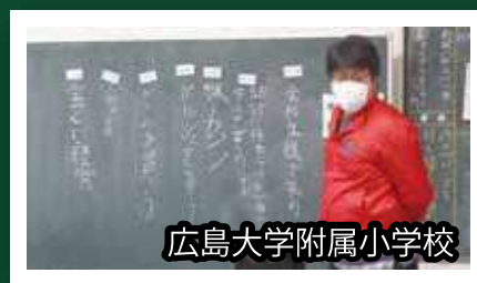
広島大学附属小学校