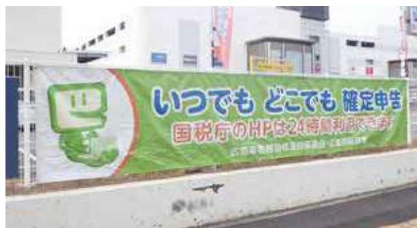
(左)イオン宇品店店舗壁面(右)コーナン広島皆実町店フェンス

また、イオン宇品店店舗壁面並びにホームセンター店舗フェンスへe-Tax利用促進の懸垂幕・横断幕を掲示し、確定申告・納税のネット利用を広く周知していくことができました。