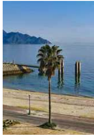
500mにわたる白い砂浜が続く入鹿海岸。夏には海水浴客で賑わう。